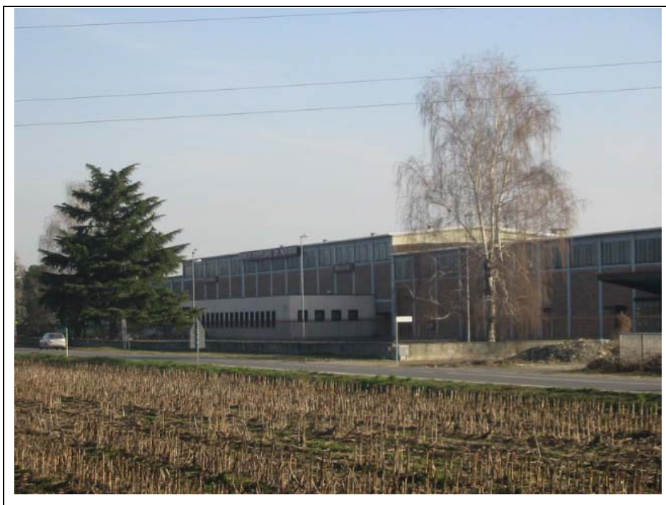
Foto n.8 Archivio della Banca Popolare di Novara lungo la strada provinciale Fara-Borgovercelli