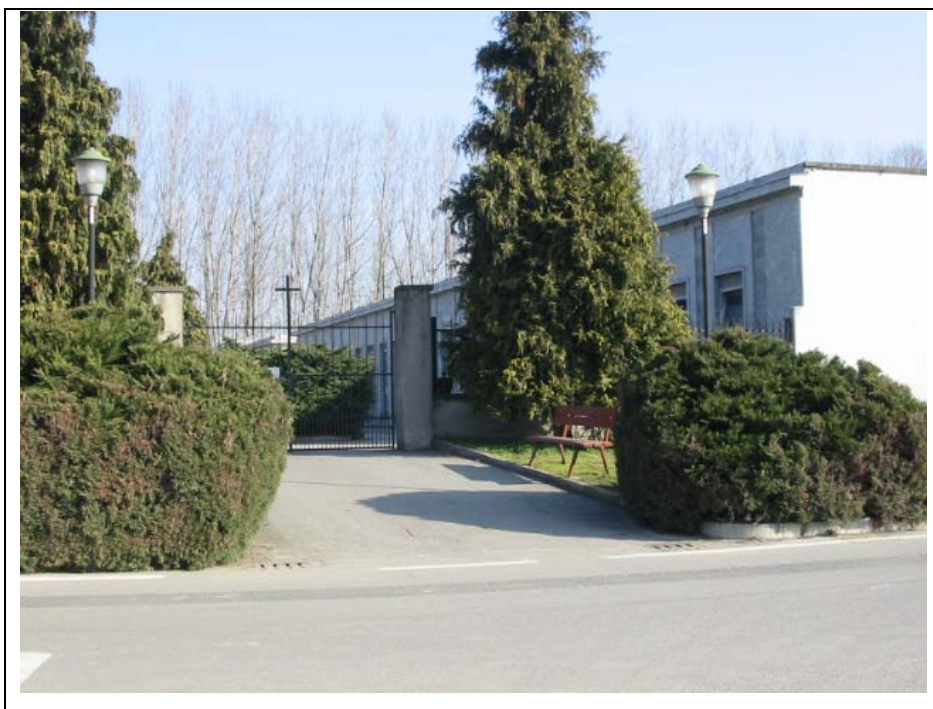
Foto n.7 Area cimiteriale in via Valsesia