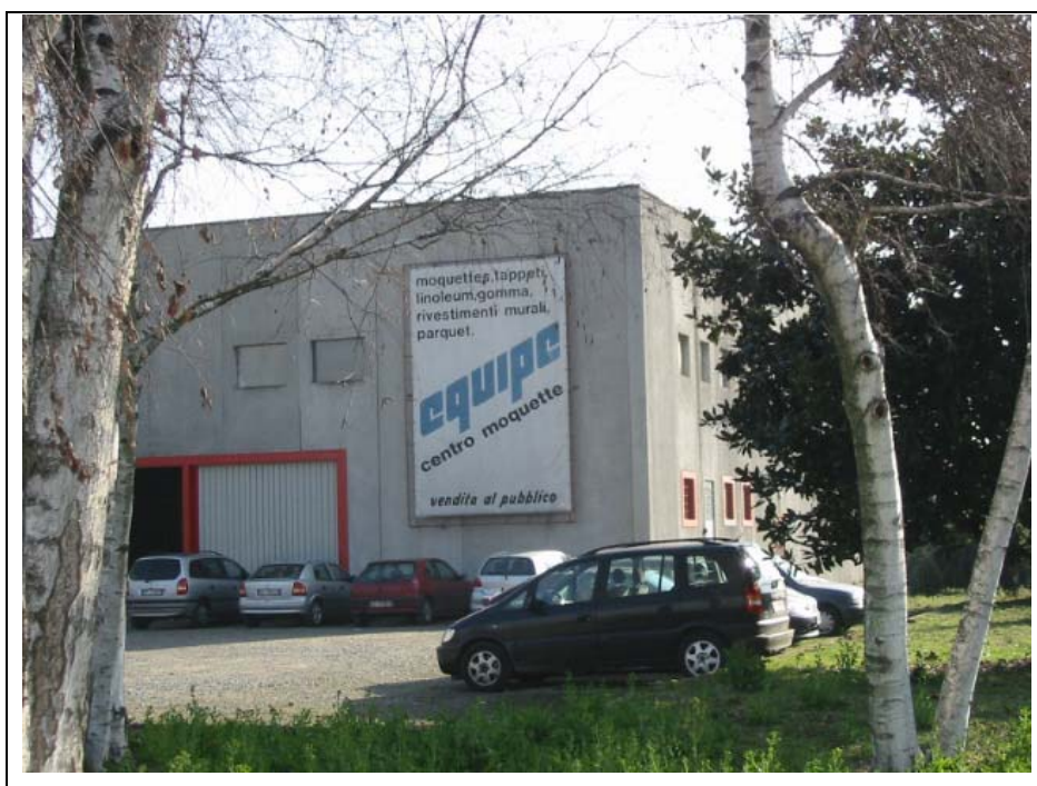
Foto n.12 Sede della ditta Equipe Centro Moquette in via Valsesia