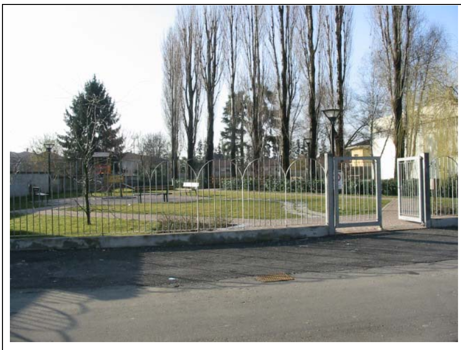
Foto n.3 Parco giochi in via Greppi