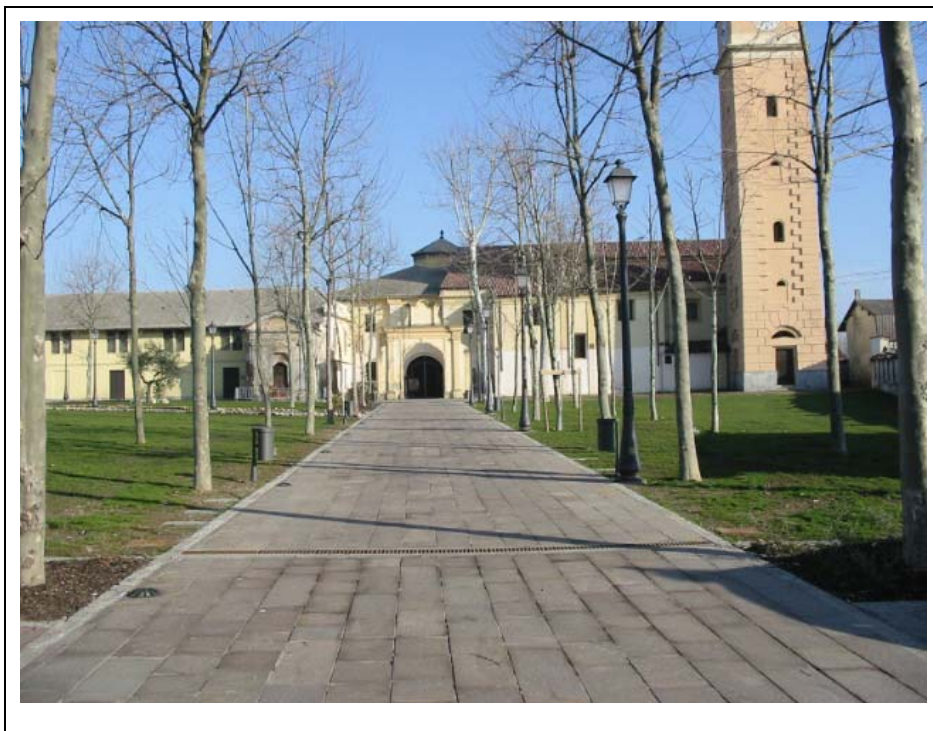
Foto n.5 Chiesa parrocchiale in via Caccianotti