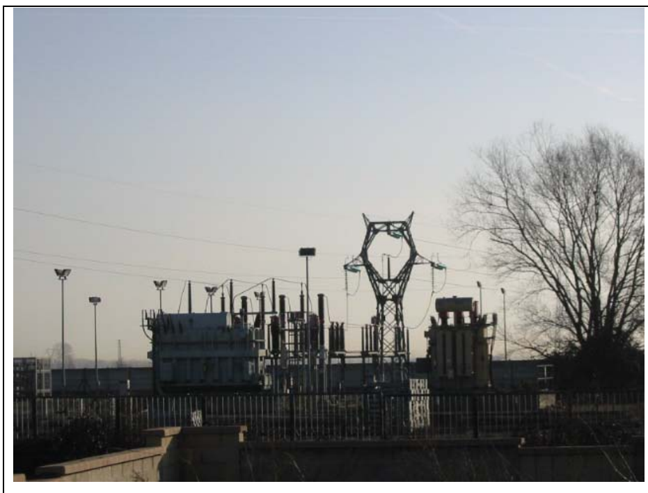
Foto n.9 Centrale Enel lungo la strada provinciale Fara-Borgovercelli