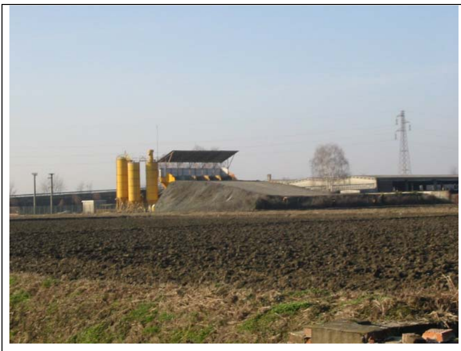
Foto n.10 Area lungo la strada provinciale da Biandrate a San Nazzaro occupata dalla ditta “Cantieri stradali Gallo s.p.a.”