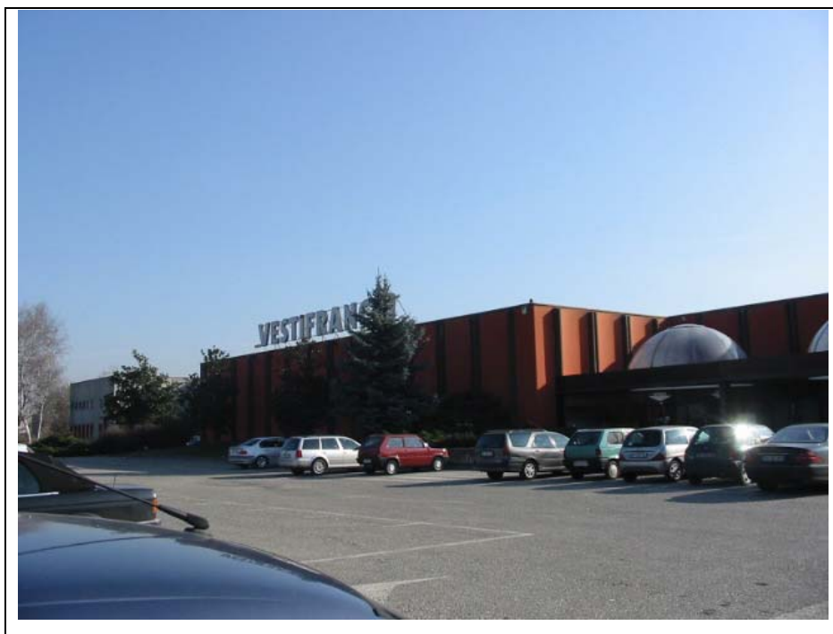
Foto n.11 Area commerciale lungo via Valsesia