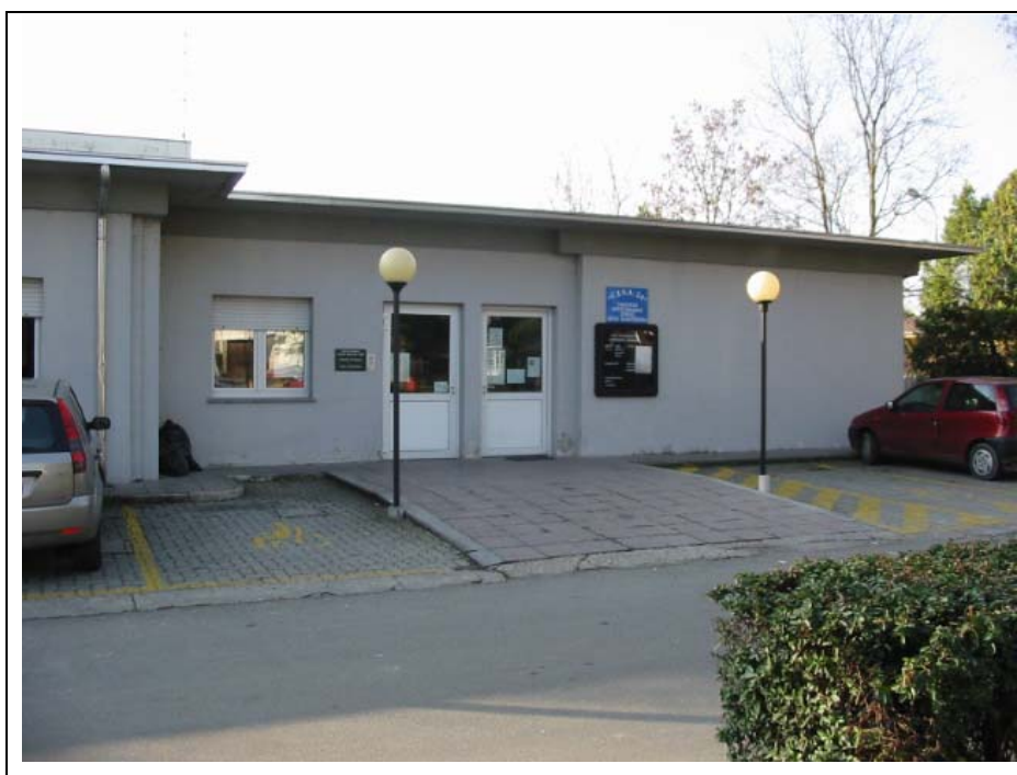
Foto n.2 ASL 13 – Sede distrettuale di Biandrate, in via Greppi