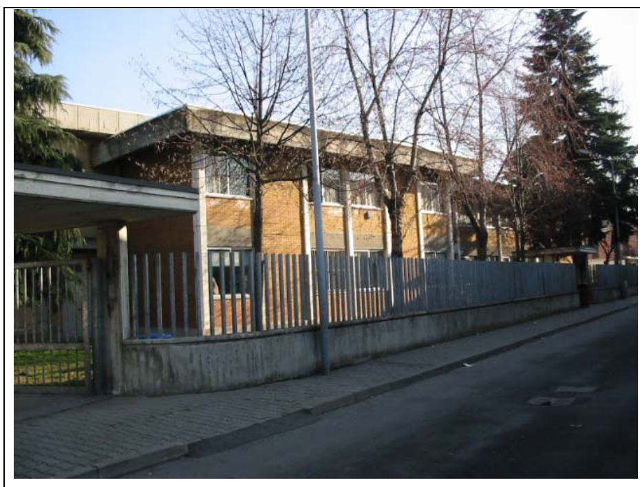
Foto n.4 Scuola Media Statale Guido da Biandrate in via Greppi