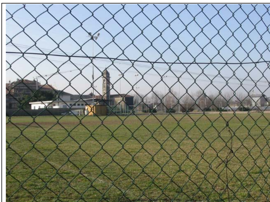
Foto n.6 Area per attrezzature sportive in via Valsesia